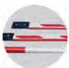
Стрелы плоского и круглого сечения