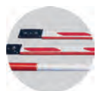
Стрелы плоского и круглого сечения