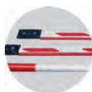
Стрелы плоского и круглого сечения